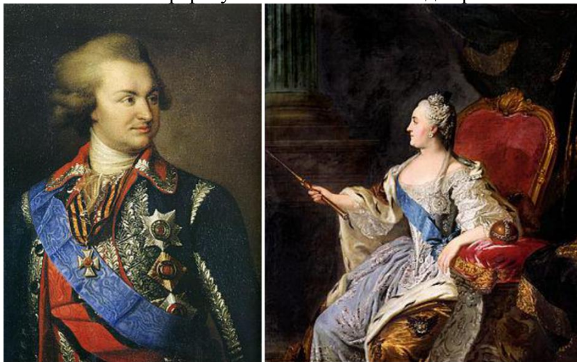
Екатери́на II Алексе́евна Вели́кая

10. Узнайте по портрету и описанию о ком идёт речь?